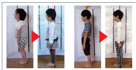
草履サンダルによる姿勢変化